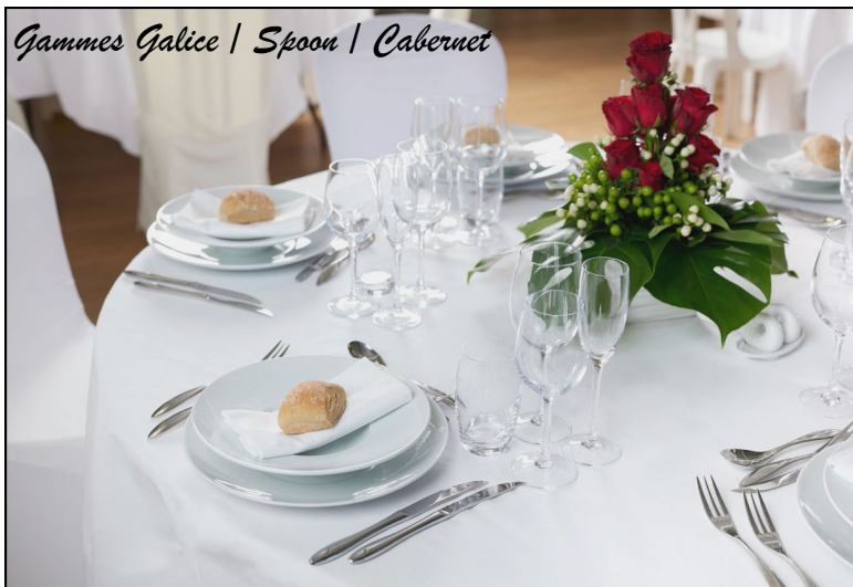
Gammes Galice | Spoon | Cabernet