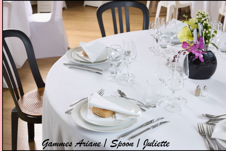
Gammes Ariane | Spoon | Juliette