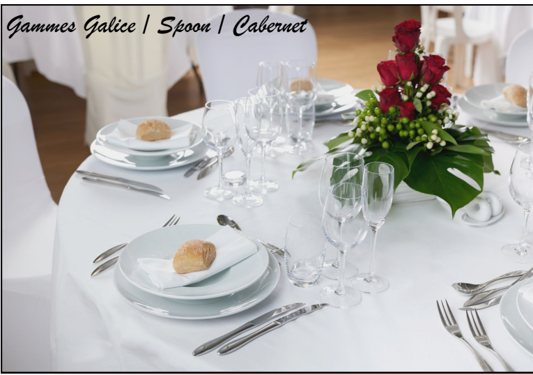
Gammes Galice | Spoon | Cabernet