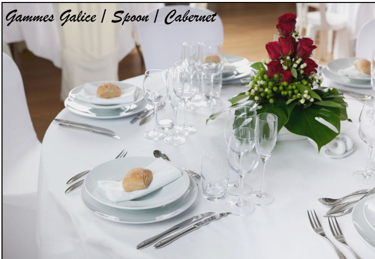
Gammes Galice | Spoon | Cabernet