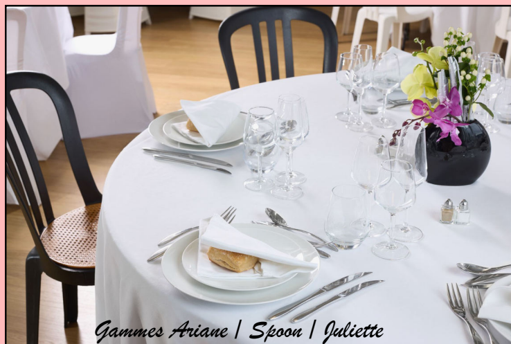
Gammes Ariane | Spoon | Juliette